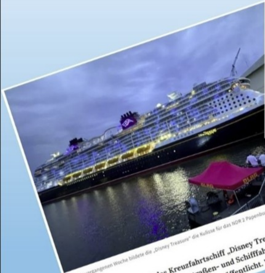
In der vergangenen Woche bildete die „Disney Treasure“ die Kulisse für das NOR 2 Papenburg Festival.

Wann verlässt das Kreuzfahrtschiff „Disney Treasure“ die Meyer Werft in Papenburg? Die Wasserstraßen- und Schifffahrtsverwaltung hat einen Termin für den 18. September veröffentlicht. Was sagt die Werft?