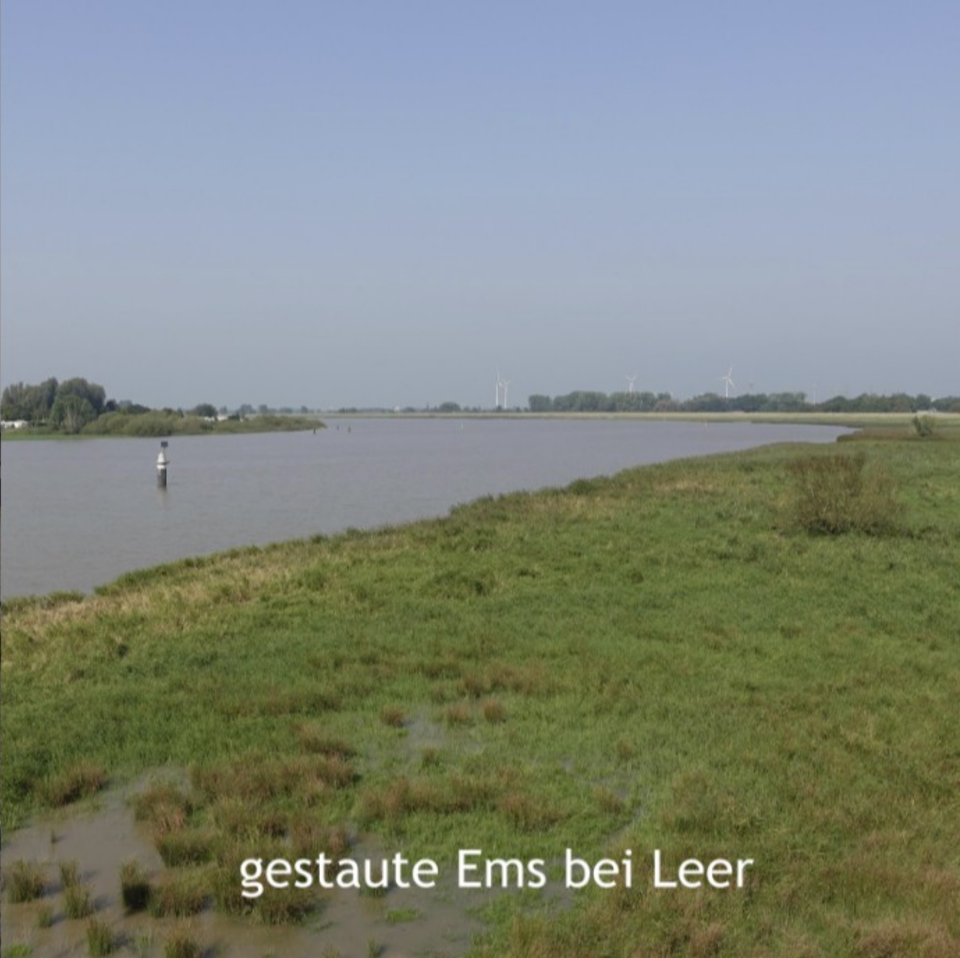
gestaute Ems bei Leer