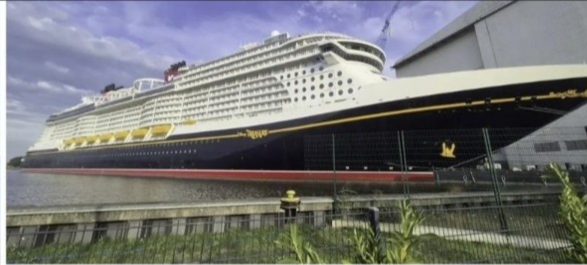
Noch liegt die „Disney Treasure“ im Hafener Meyer Werft, das könnte sich nächste Woche ändern.

Wann verlässt das Kreuzfahrtschiff „Disney Treasure“ die Meyer Werft in Papenburg? Die Wasserstraßen- und Schifffahrtsverwaltung hat einen Termin für den 18. September veröffentlicht. Was sagt die Werft?