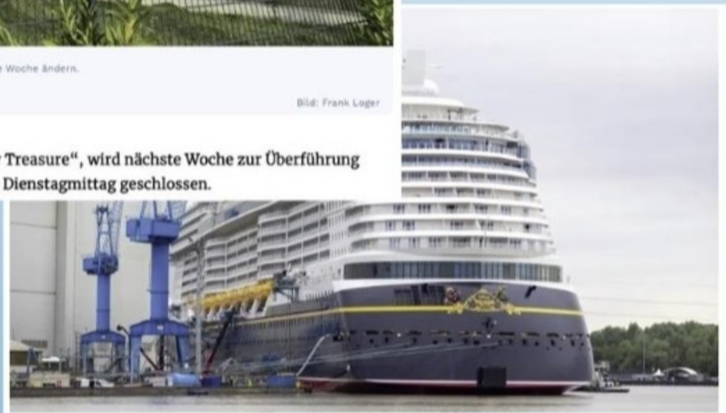
Mit der Überführung über die Ems rückt die Ablieferung der „Disney Treasure“ näher. Sie ist das zweite Schiff der sogenannten „Wish-Class“. Ende des Jahres unternimmt sie ihre erste Kreuzfahrt in die Karibik.

Das neueste Kreuzfahrtschiff der Meyer Werft, die „Disney Treasure“, wird nächste Woche zur Überführung in die Nordsee vorbereitet. Das Emssperrwerk wird dafür ab Dienstagmittag geschlossen.