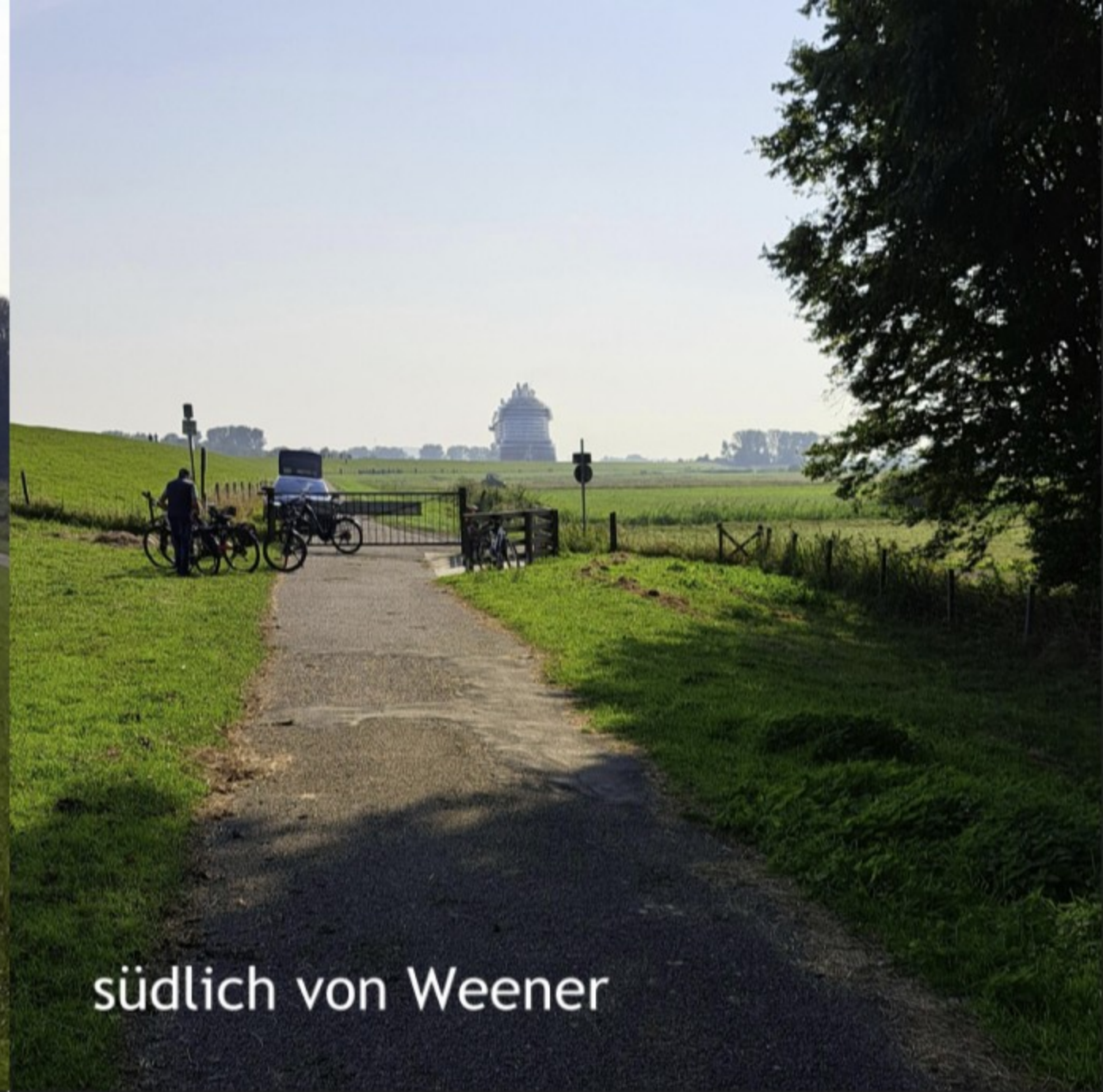
südlich von Weener