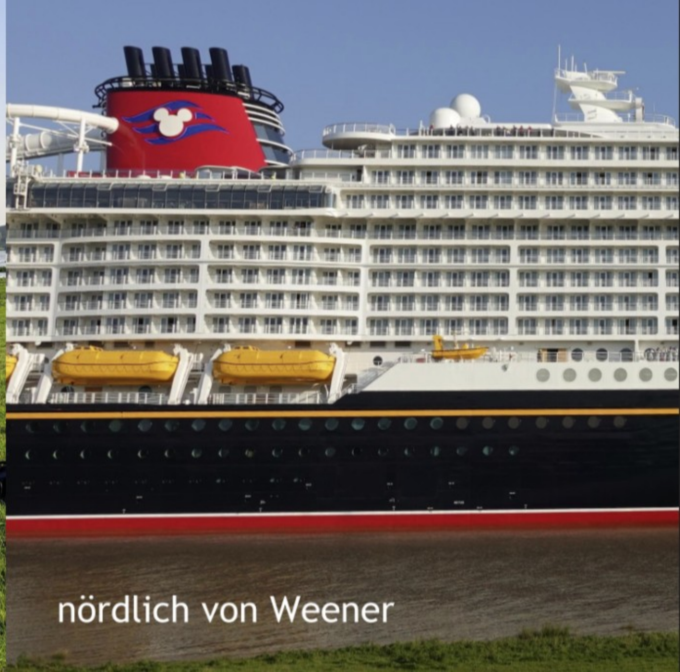
nördlich von Weener