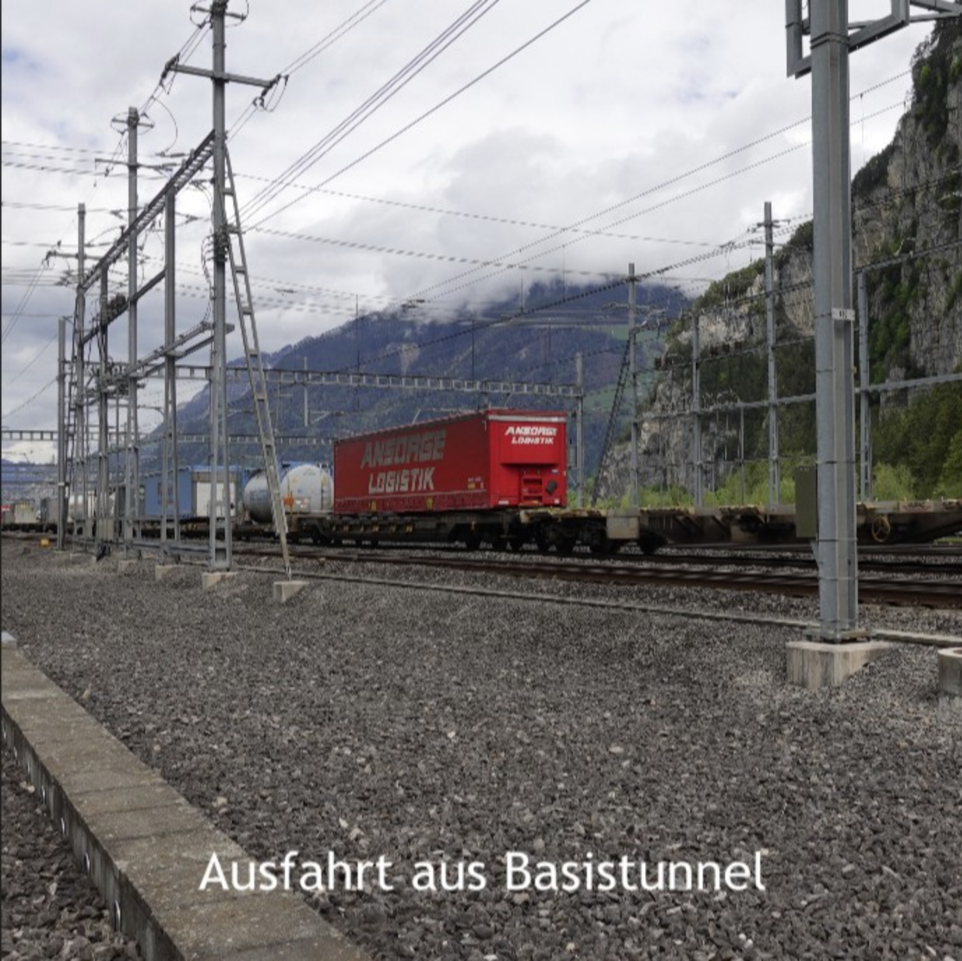
Ausfahrt aus Basistunnel