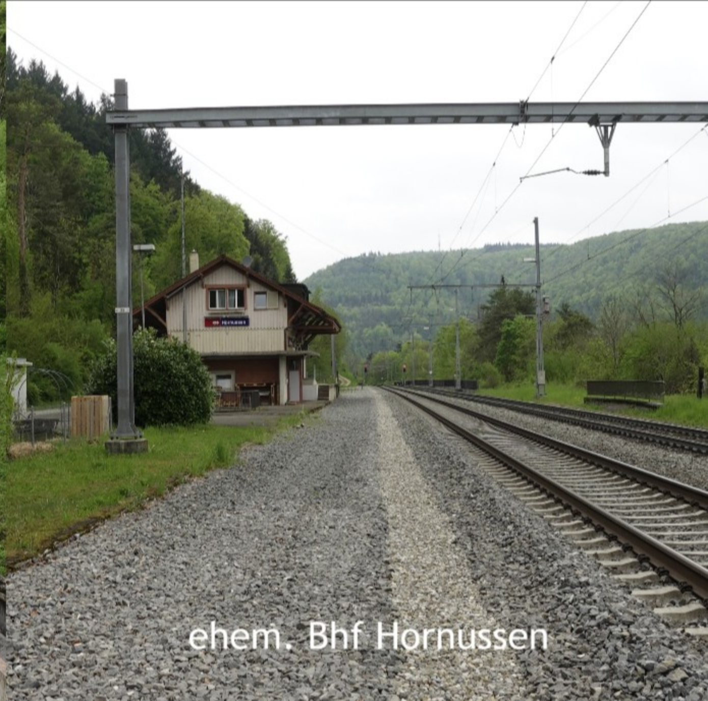
ehem. Bhf Hornussen