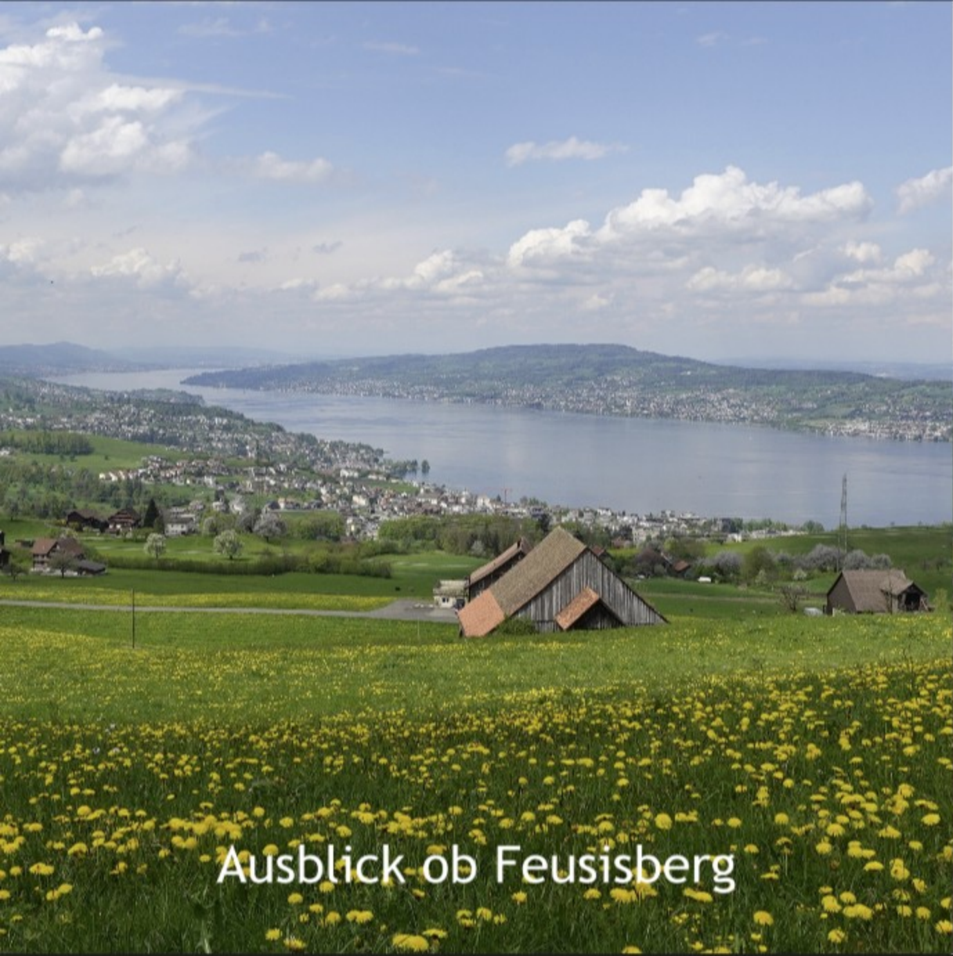
Ausblick ob Feusisberg