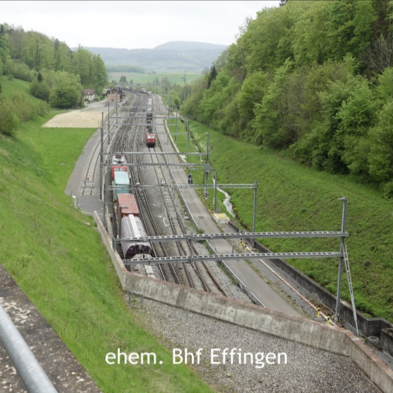
ehem. Bhf Effingen