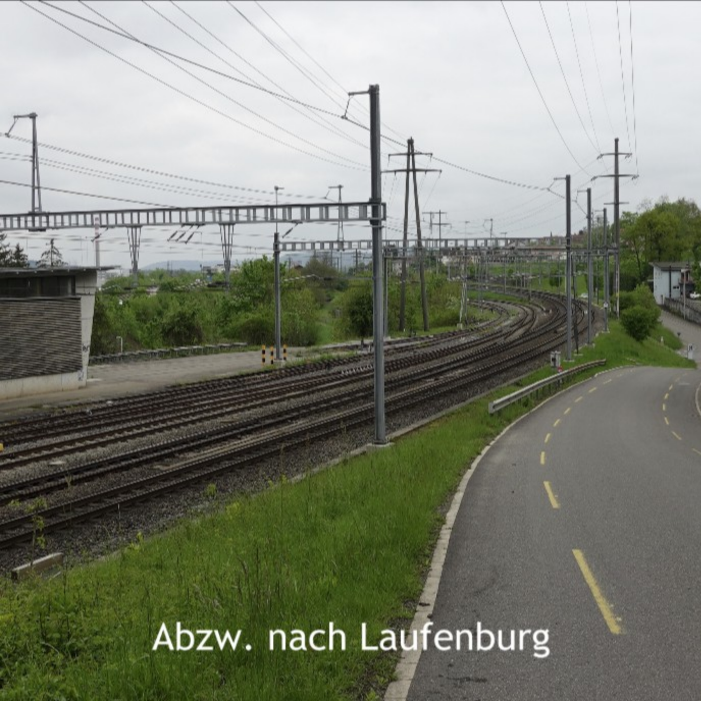
Abzw. nach Laufenburg