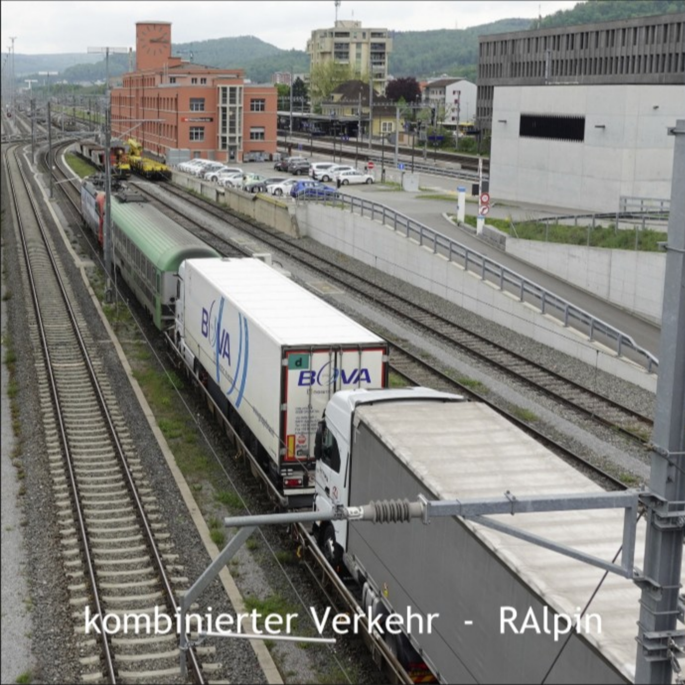
kombinierter Verkehr - RAipin