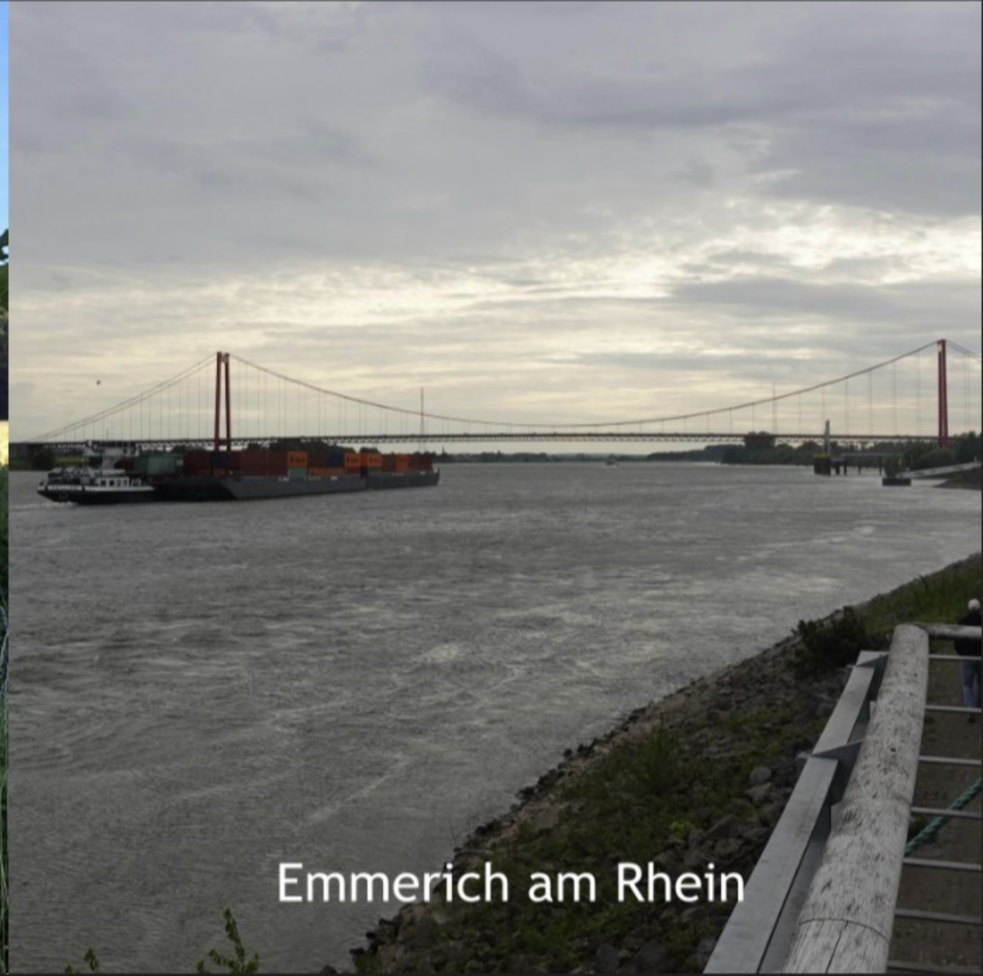
Emmerich am Rhein