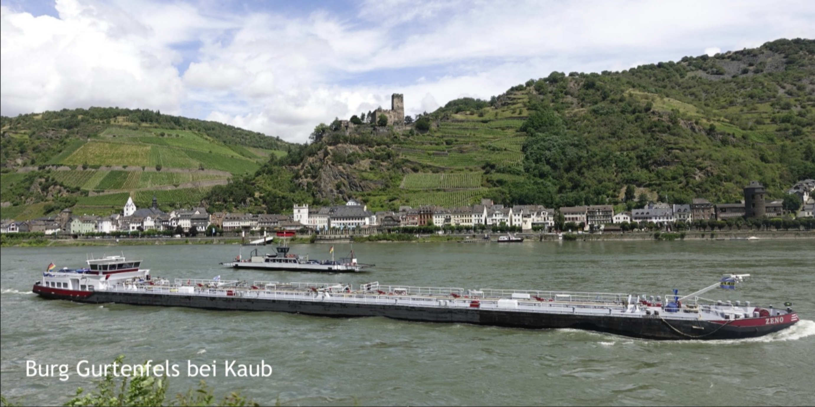
Burg Gurtenfels bei Kaub