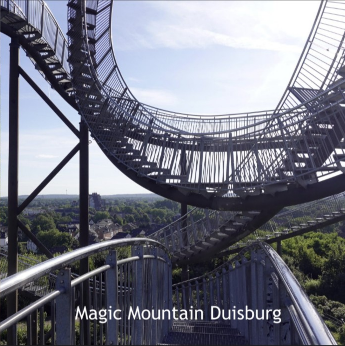
Magic Mountain Duisburg