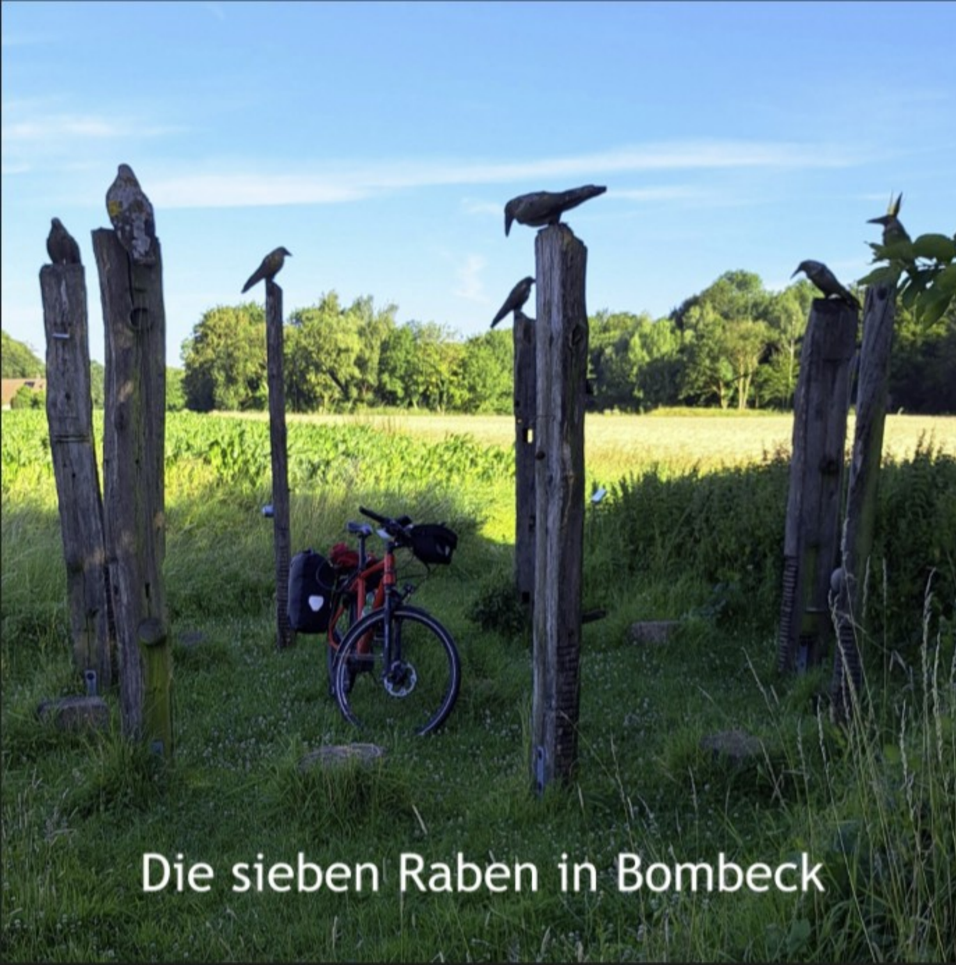
Die sieben Raben in Bombeck