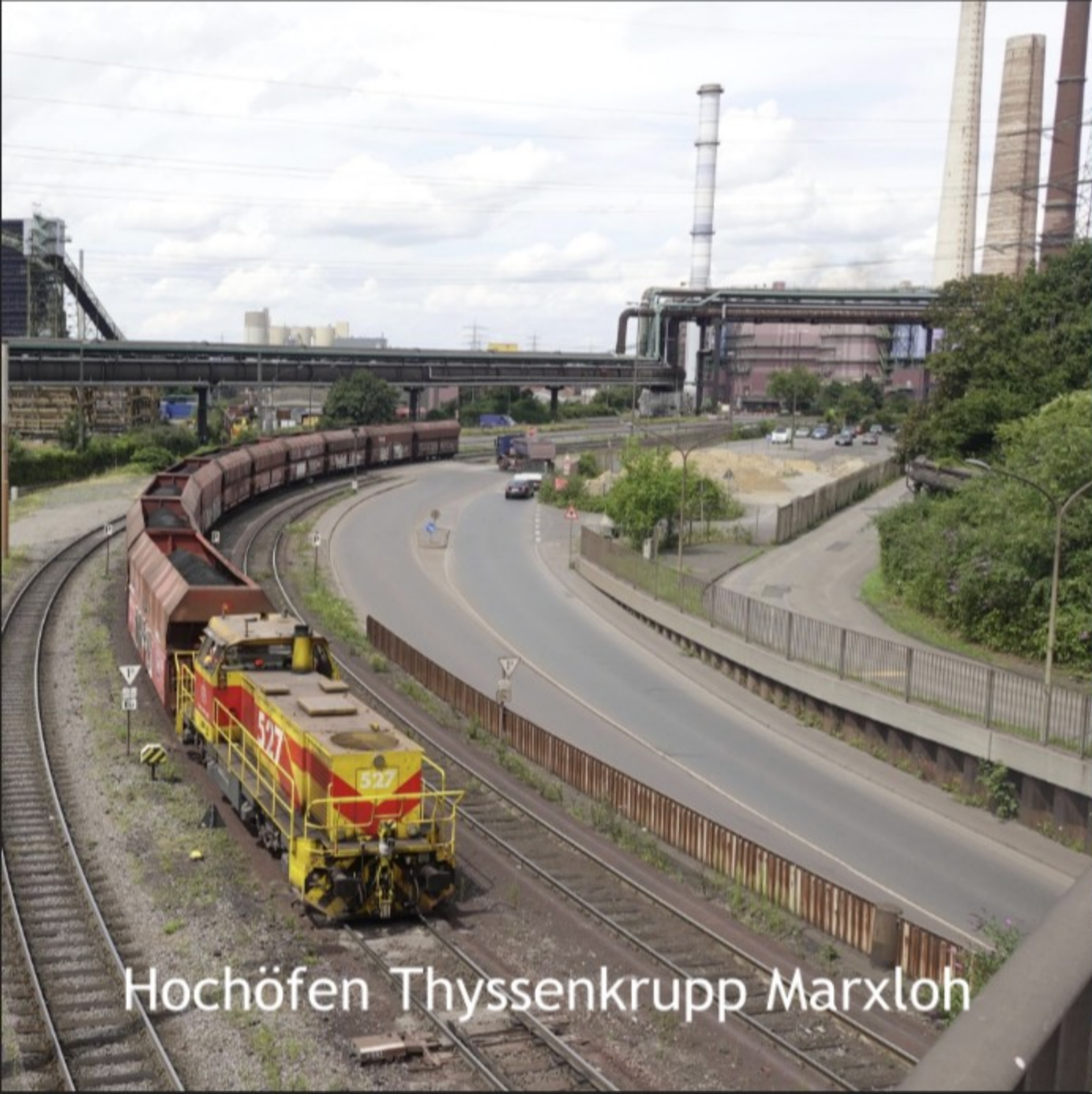
Hochöfen Thyssenkrupp Marxloh