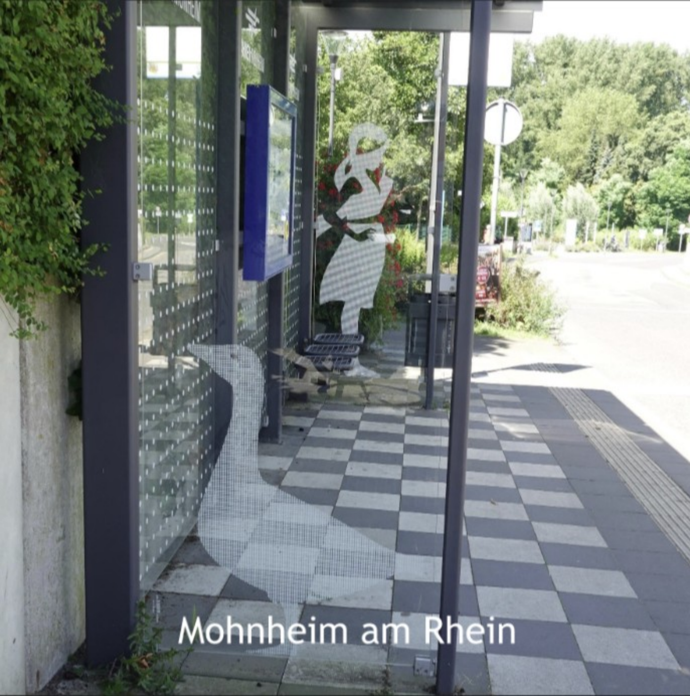
Mohnheim am Rhein