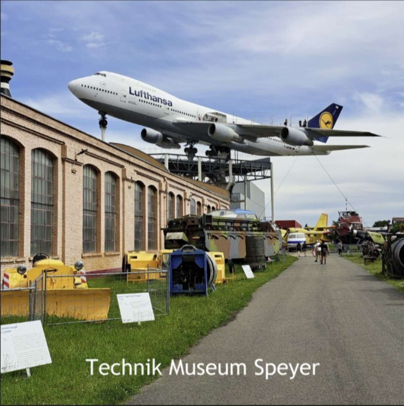
Technik Museum Speyer