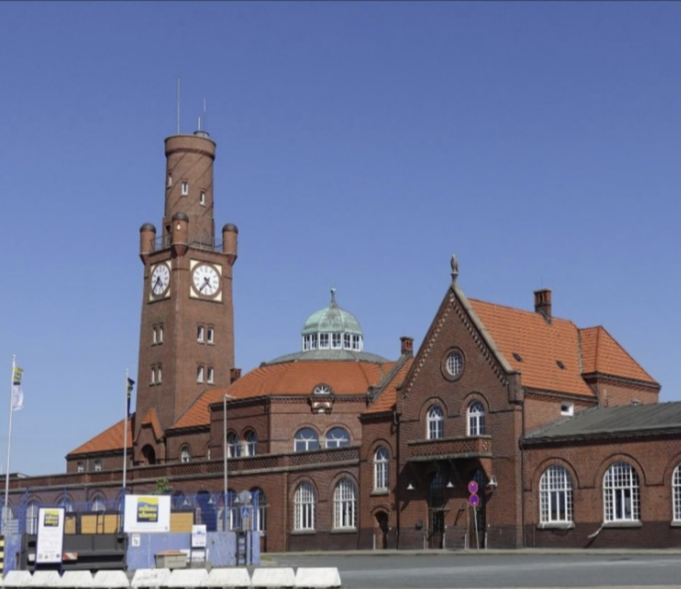
Hapag Hallen Cuxhaven