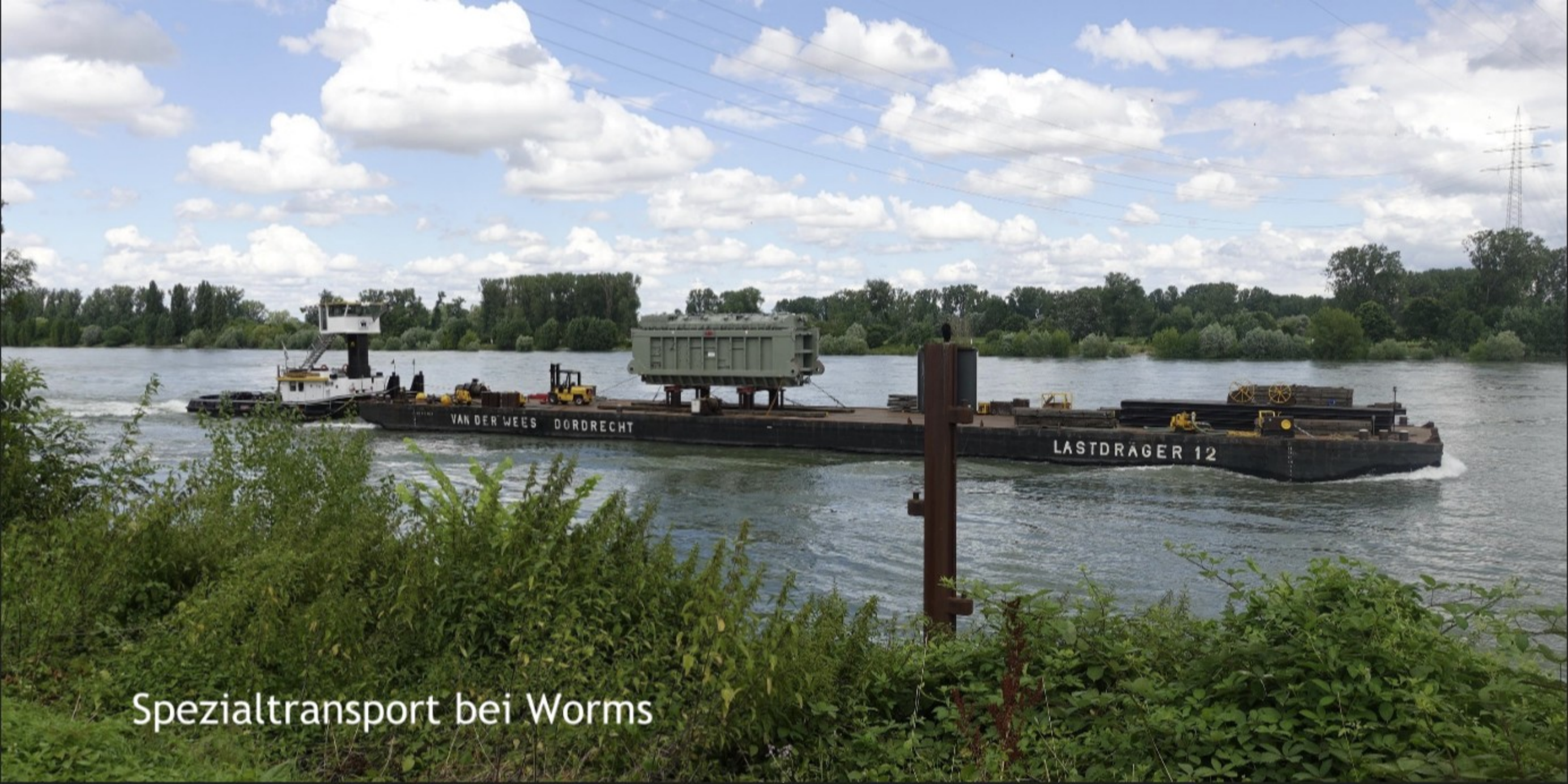
Spezialtransport bei Worms