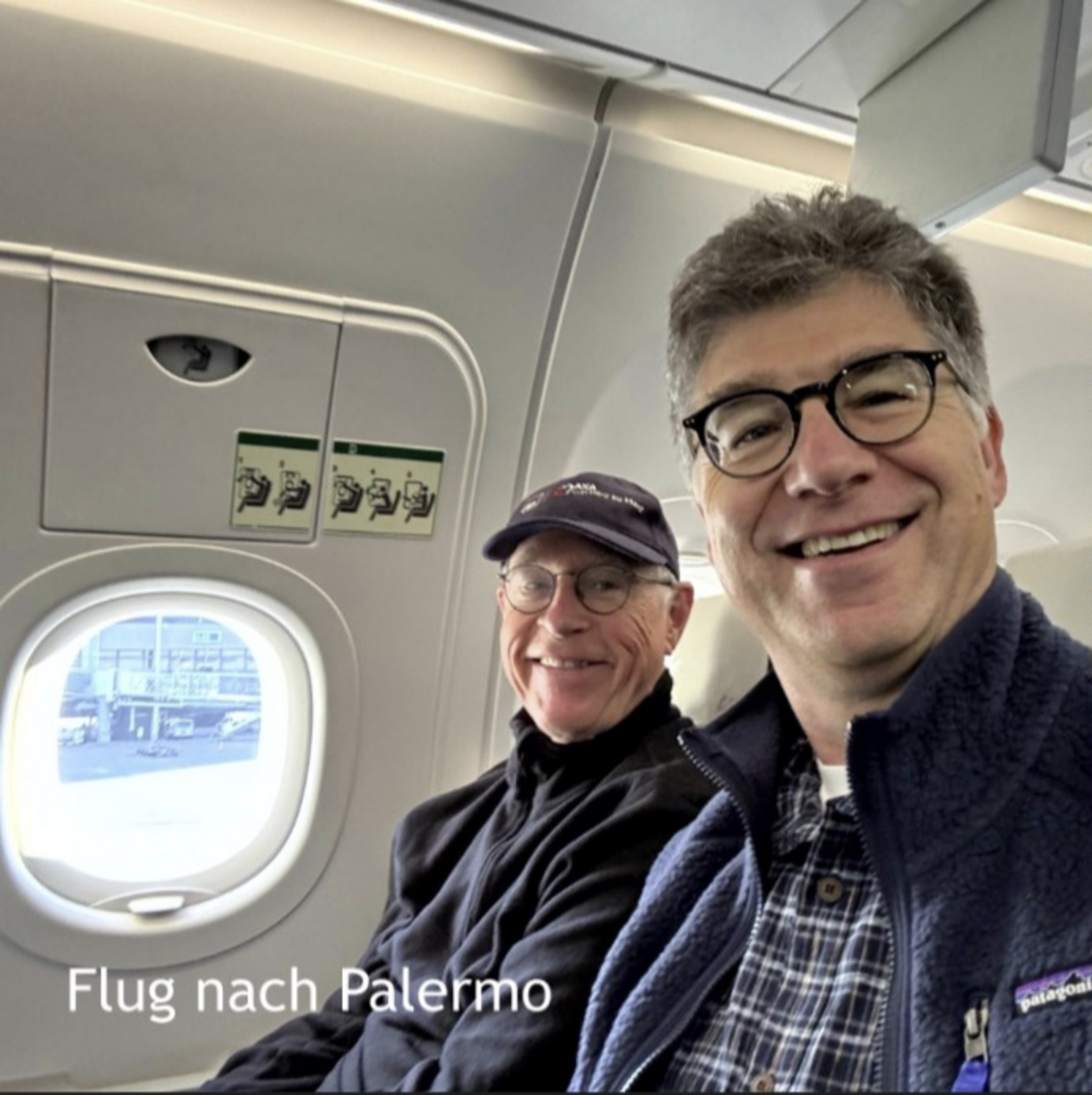
Flug nach Palermo