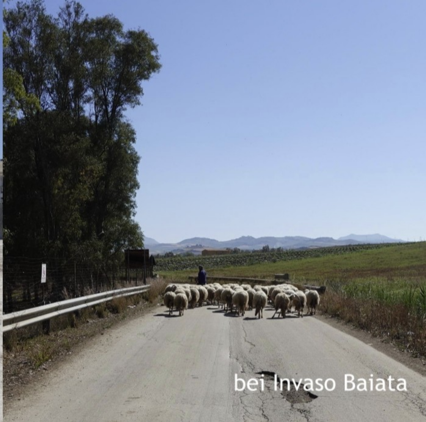
bei Invaso Baiata