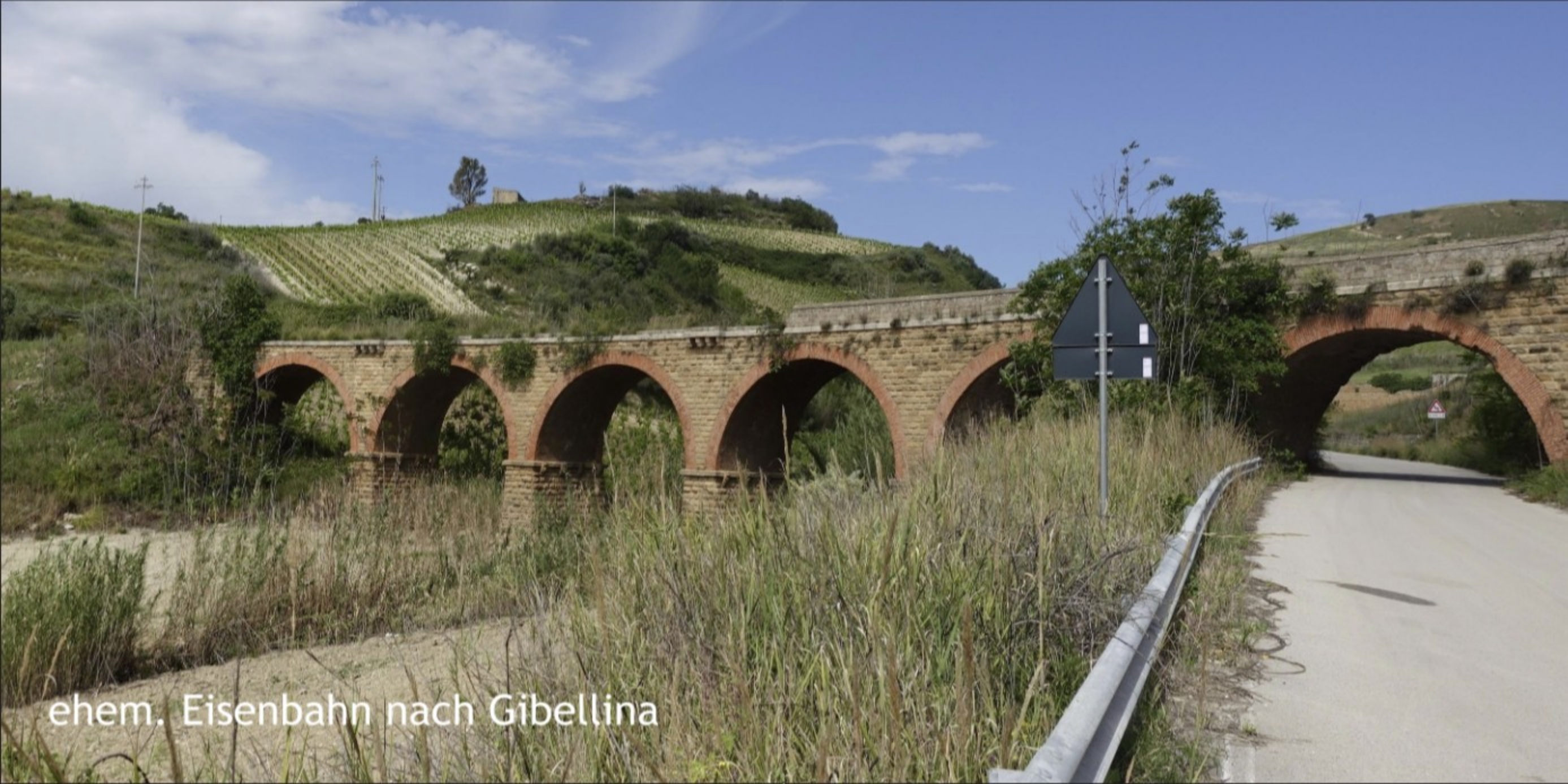
ehem. Eisenbahn nach Gibellina