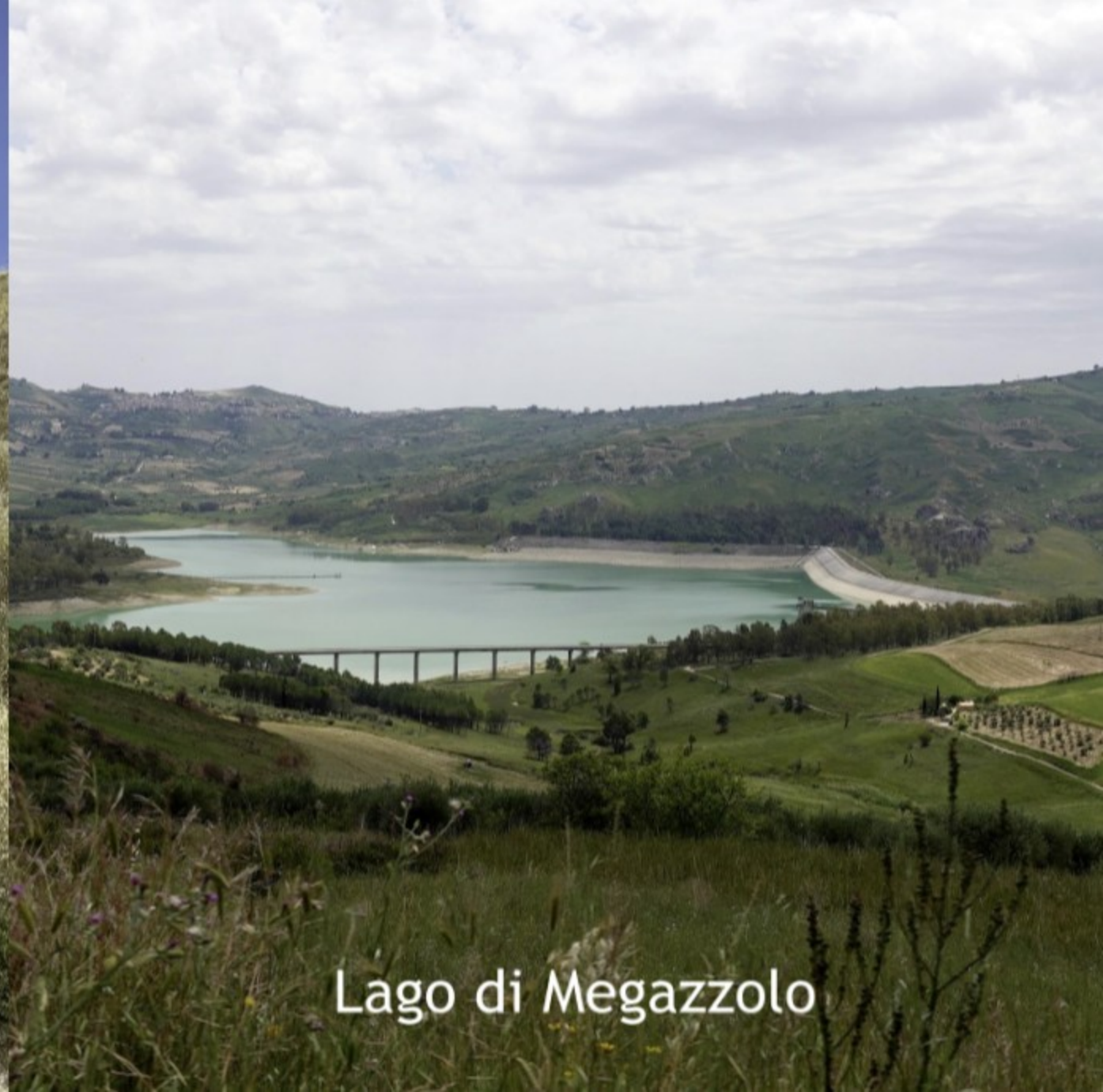
Lago di Megazzolo