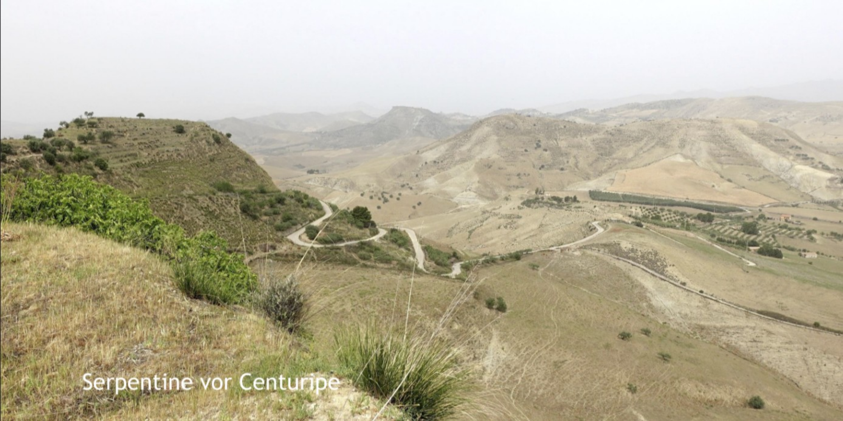
Serpentine vor Centuripe