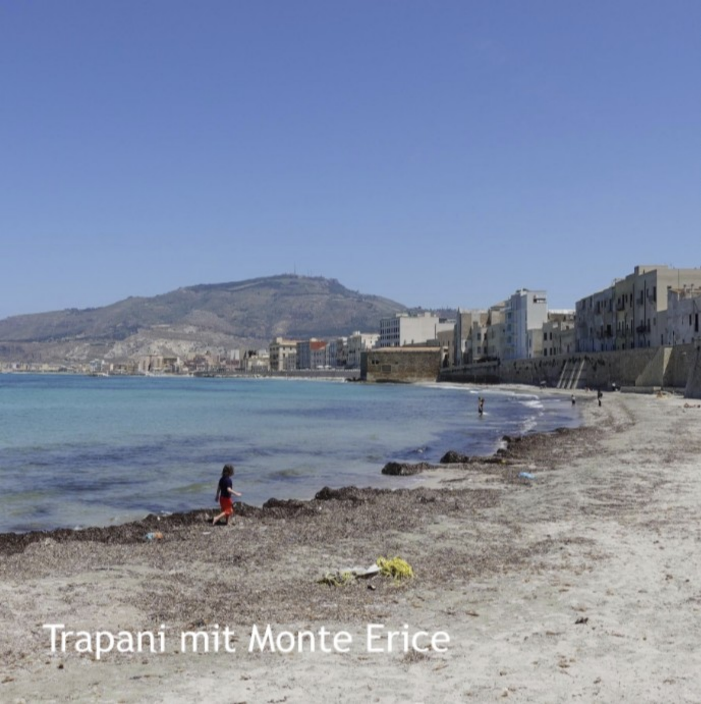
Trapani mit Monte Erice