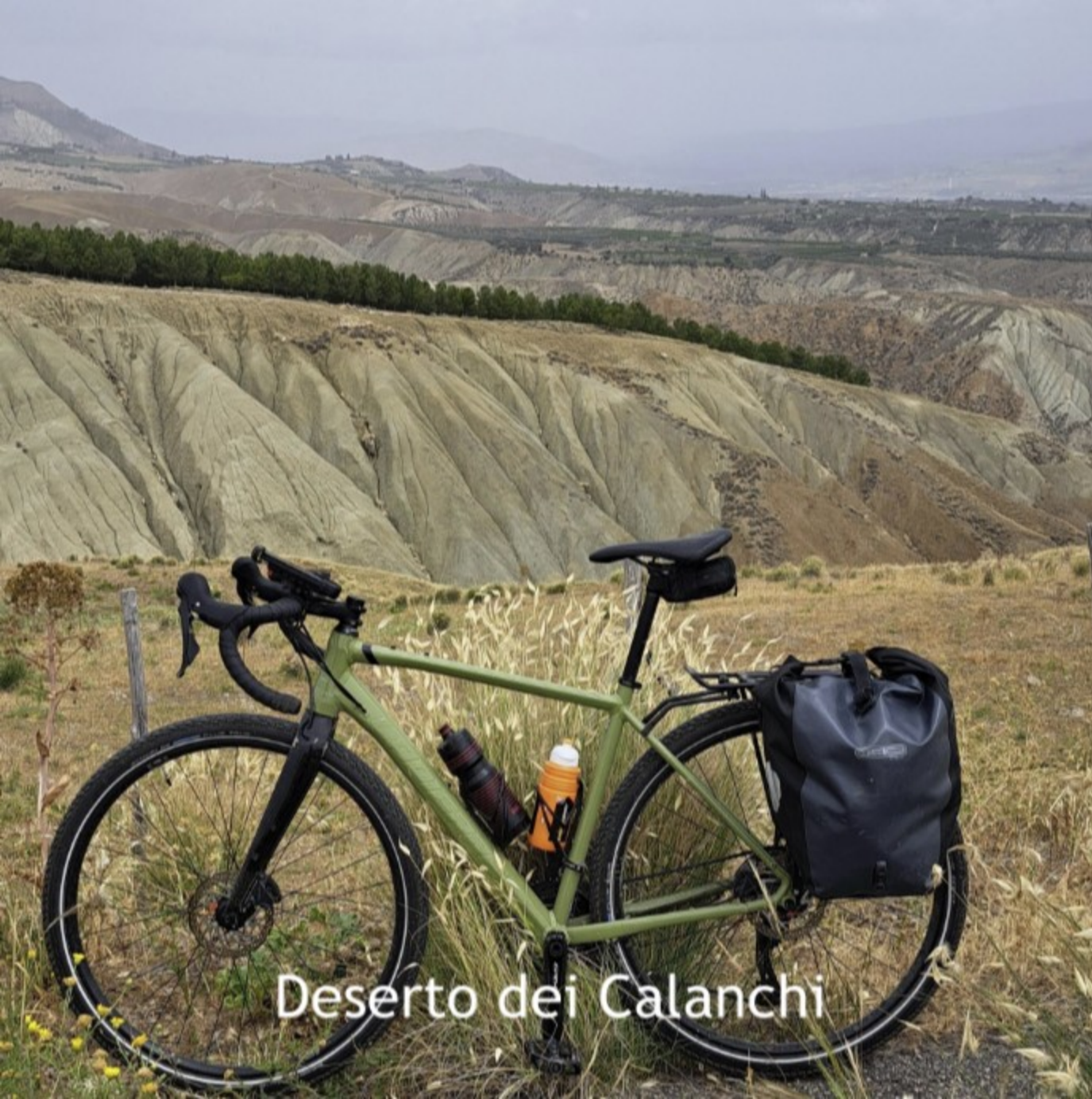
Deserto dei Calanchi