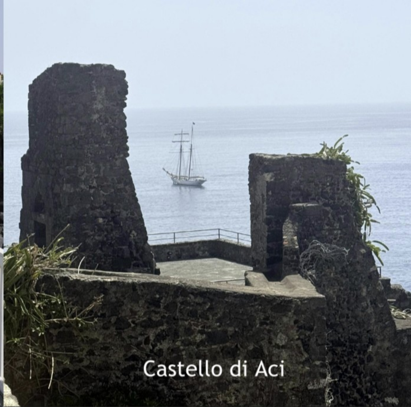
Castello di Aci